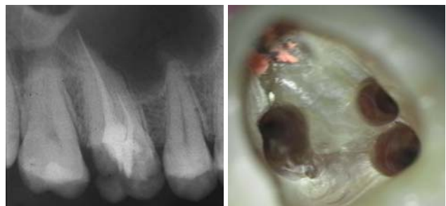
Abb. 1: Ausgangsröntgenbild des insuffizient gefüllten Zahnes 16. – Abb. 2: Darstellung aller Wurzelkanaleingänge. Die palatinale Wurzelfüllung wird belassen, da sie für gut befunden wird.

Nach erfolgter Information über die vermutete Prognose unternehmen wir den Versuch, das frakturierte Instrument darzustellen. Nach Entfernung der Aufbau-füllung werden die Kanaleingänge dargestellt (Abb. 2). Es zeigt sich, dass neben dem distovestibulären Kanal auch ein vierter Kanal (mb2) vorhanden ist. Die Darstellung der Wurzelkanaleingänge erfolgt in unserem Haus mit dem Aufsatz 1R des Tigon+. Dank der Abwinkelung